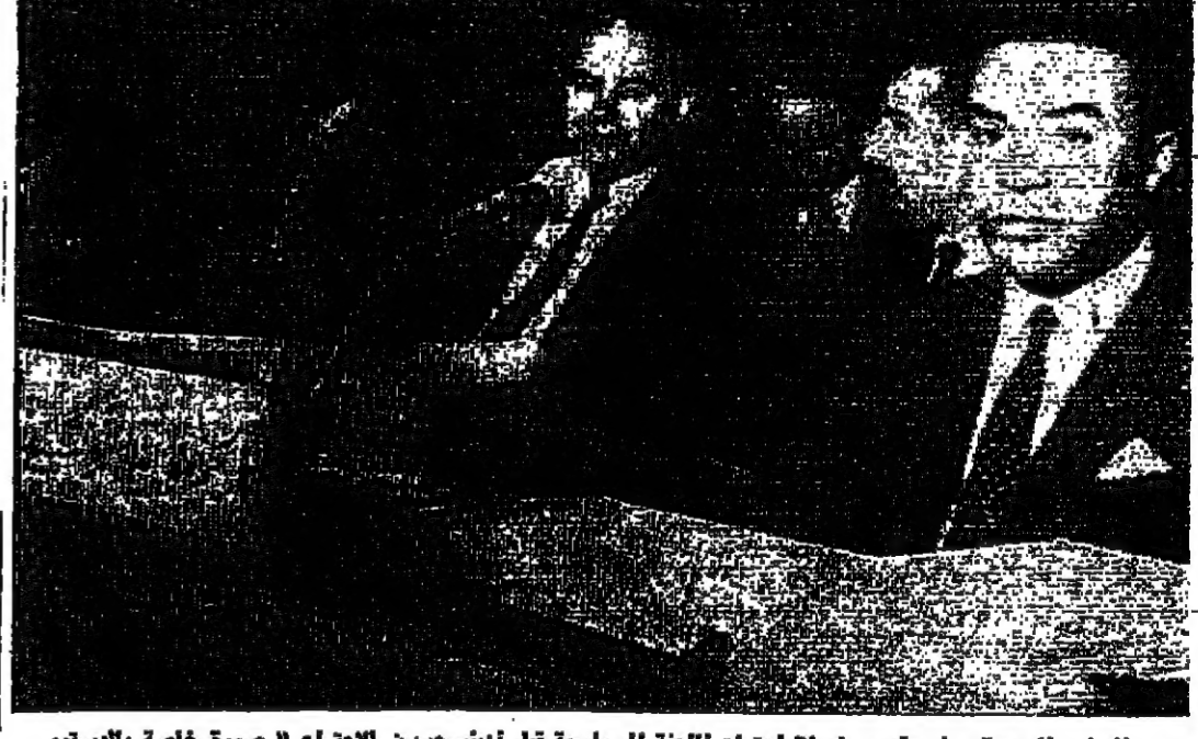
السفير السجاني في مقدمه خلال اجتماع اللجنة السياسية قبل ان يتسحب من الاجتماع « صورة خاصة بالدستور من مندوبها في القاهرة »